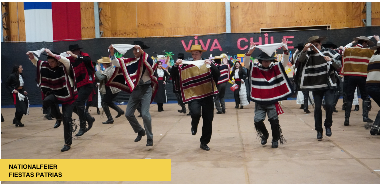
NATIONALFEIER FIESTAS PATRIAS

Nuestra querida comunidad escolar preparó durante semanas variadas Muestras Folclóricas que representan los orígenes culturales de esta celebración patria.